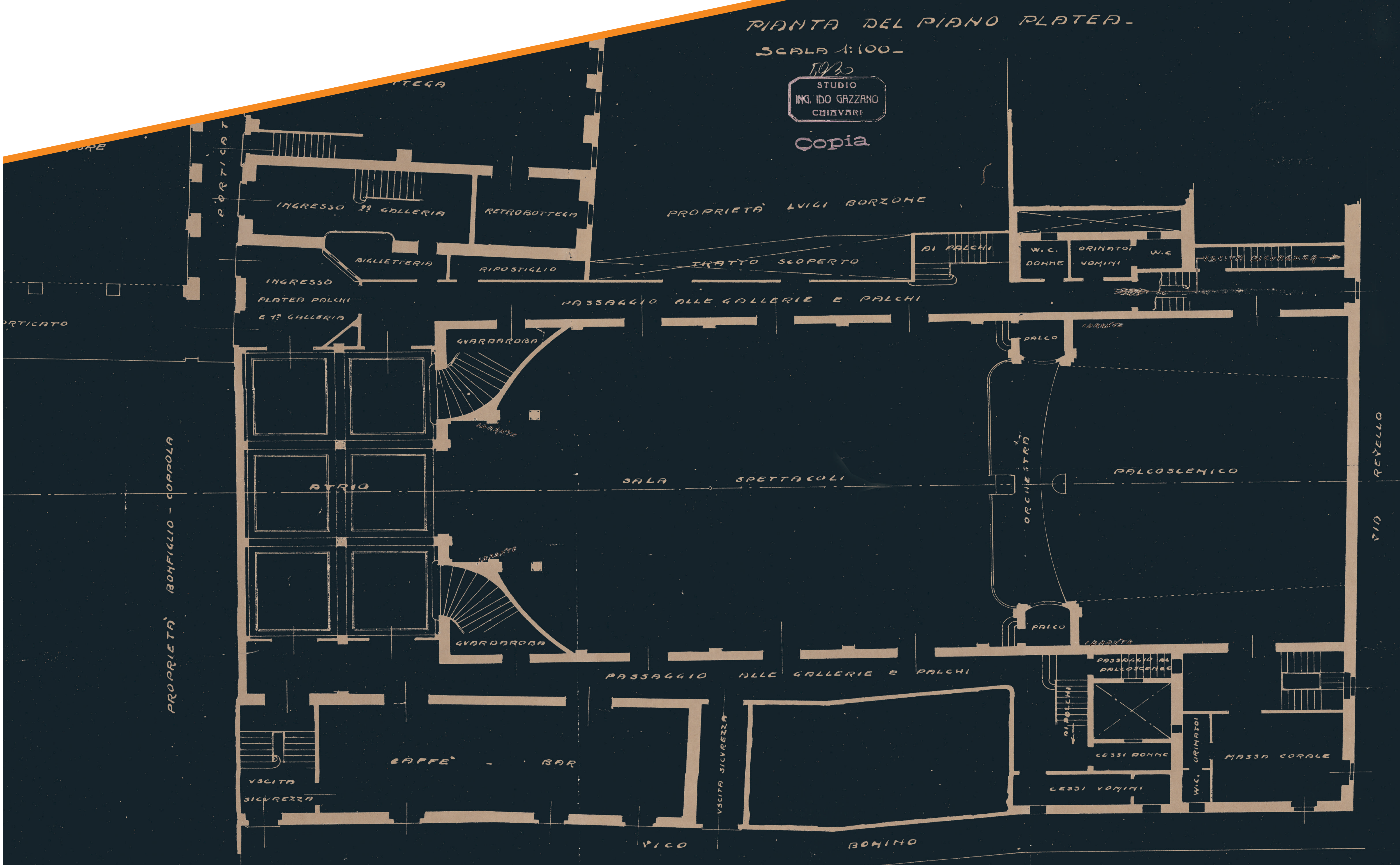
Pianta di progetto al livello platea - Ing. Ido Gazzano