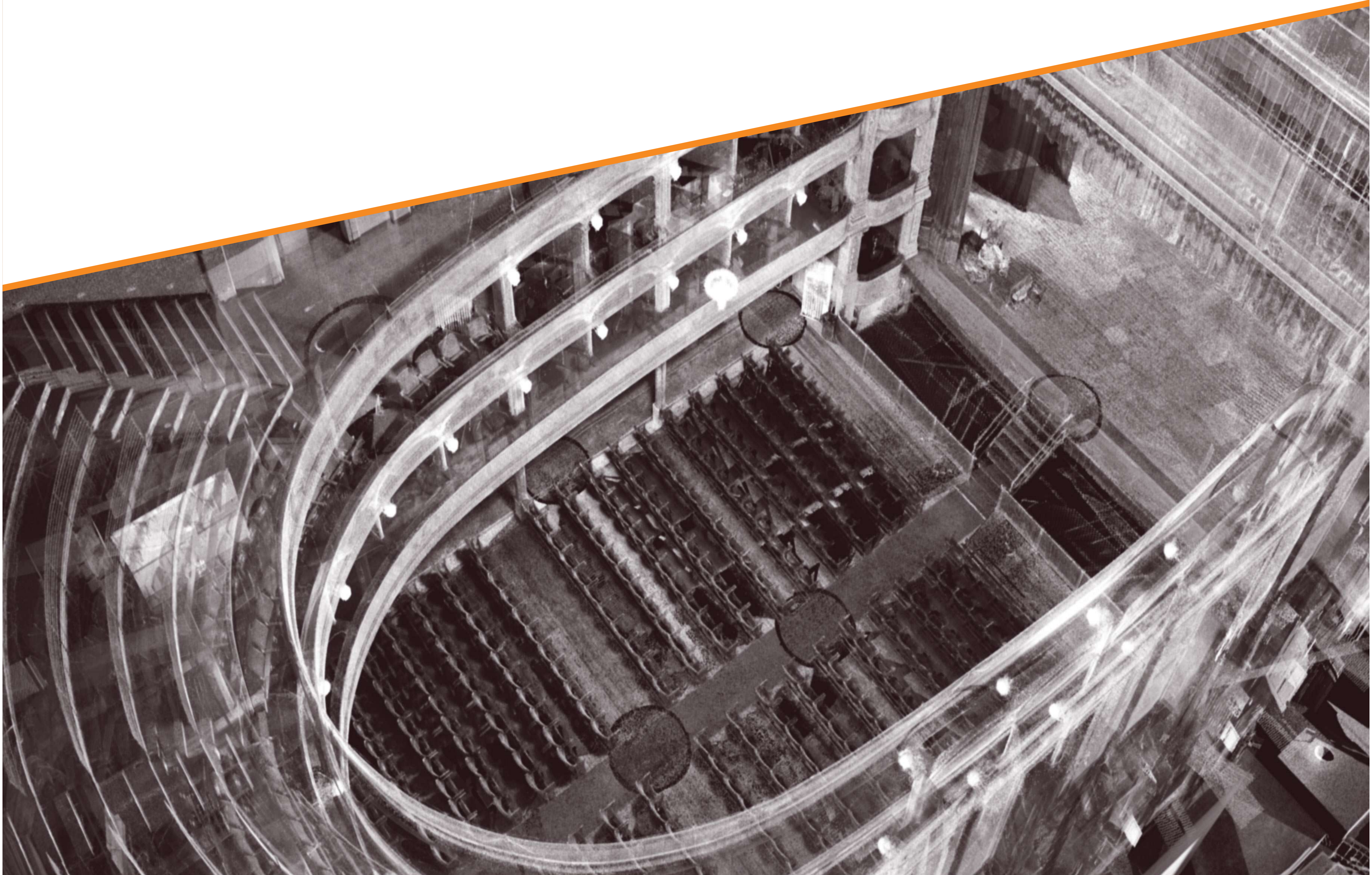
Ricostruzione digitale tridimensionale del Teatro